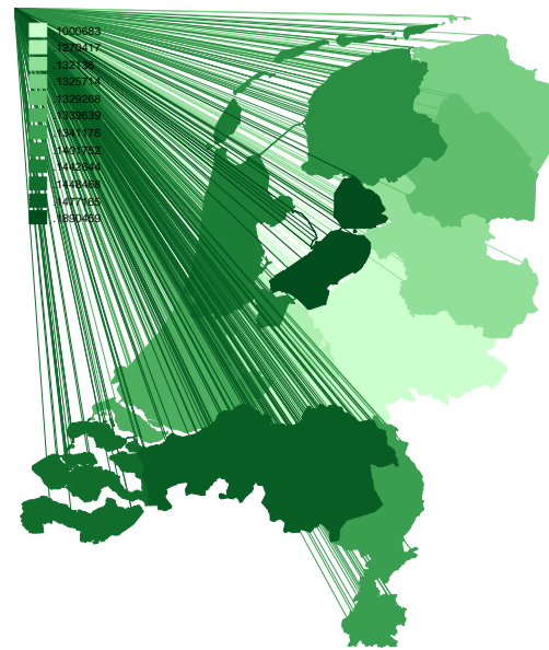
Figuur 2: marktaandeel energielabels Q42011